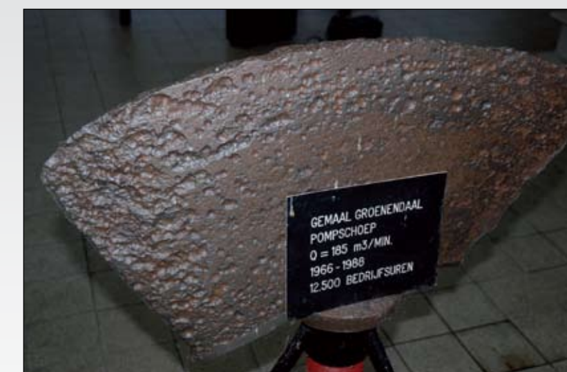
Een gladde pompschroef die onderhevig is aan cavitatie

Al naar gelang de hevigheid van cavitatie, schoepmateriaal en type media, zal het uiterlijk van een pompschoep veranderen van een glad oppervlak naar een soort van maanlandschap. En dan hebben we het nog over het meest gunstige geval want er kunnen ook grote gaten in een waaier of het pomphuis ontstaan. Bij grote omtreksnelheden kan de schoep soms helemaal vast smelten met het pomphuis. Door de implosie van de dampbellen komt er zo'n geweldige kracht vrij dat